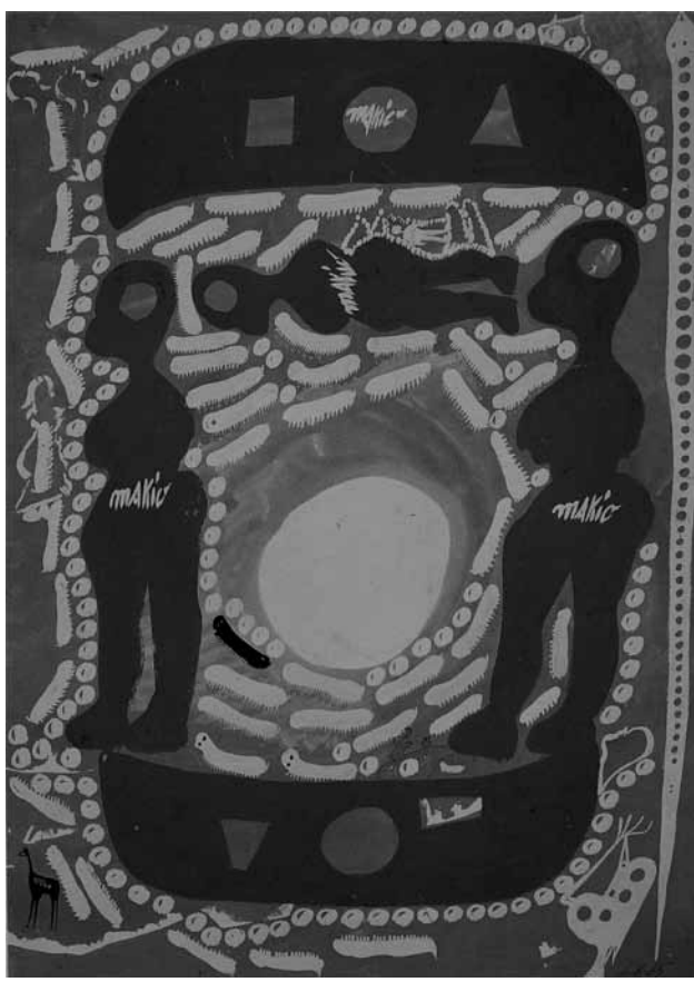
Fig. 12. Carlo Zinelli, Cerchio bianco con due barche e bruchi, 1965