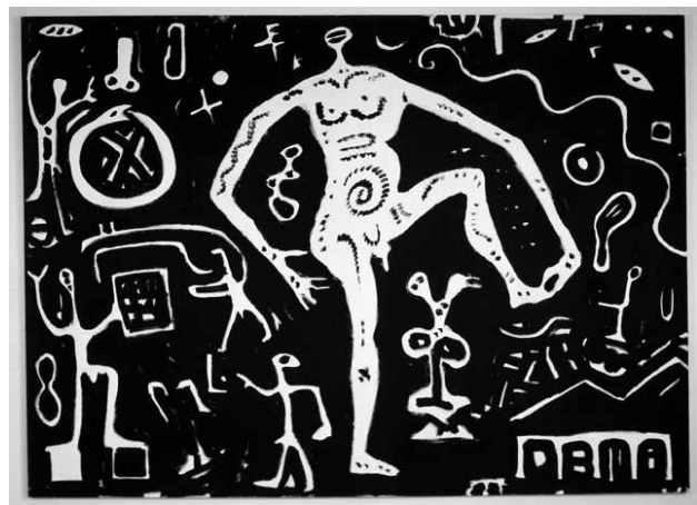
Fig. 2. A.R. Penck, Am Fluss (Hypothesis 1) , 1982, olio su tela