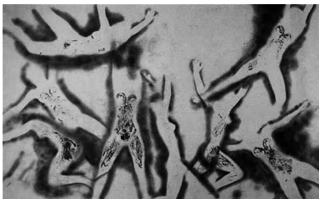
Fig. 7. Y. Klein, Humans Begin to Fly, 1961