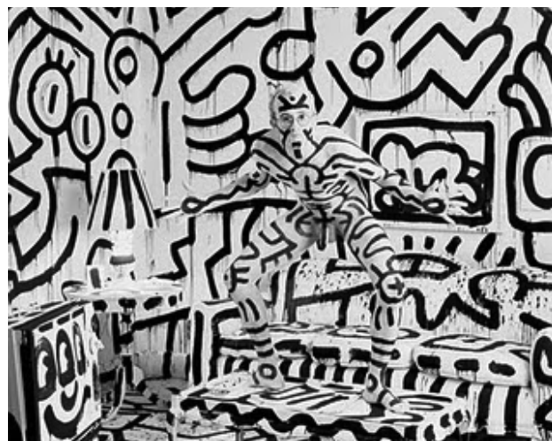
Fig. 4. Annie Leibovitz, Keith Haring, 1986