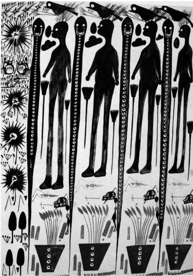
Fig. 9. Carlo Zinelli, Uomini e serpenti con vasi di fiori azzurri, 1961