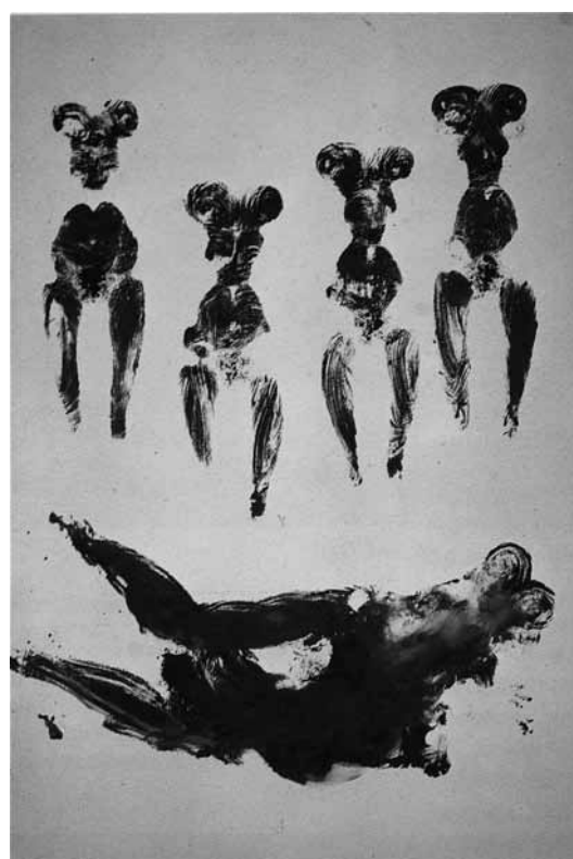
Fig. 6. Yves Klein, Anthropométrie 74, 1960