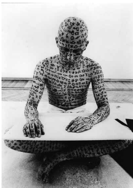
Fig. 1. Claudio Parmiggiani, Deiscrizione , 1972