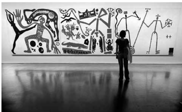
Fig. 3. A.R.Penck, Triptych to Basquiat