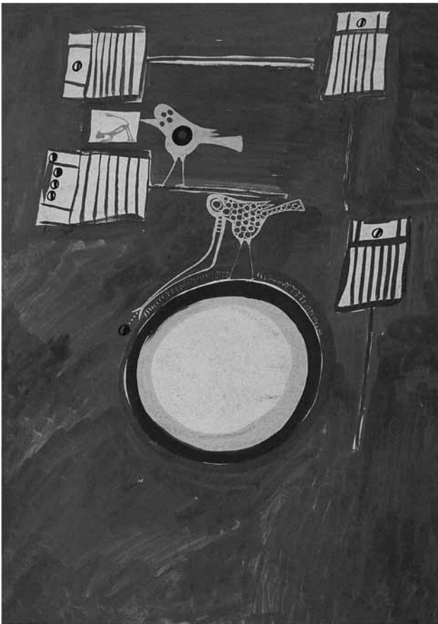
Fig. 11. Carlo Zinelli, Cerchio bianco e uccello dal lungo becco, 1964