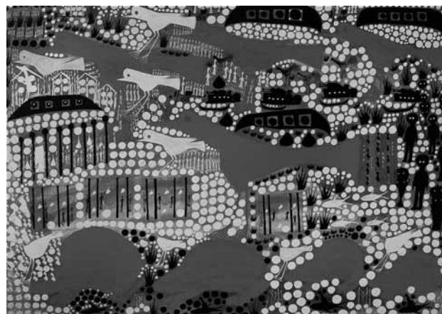
Fig. 8. Carlo Zinelli, Uccelli e animali rossi su sfondo di piccoli cerchi, 1963-64